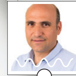
Ο δρ Γιώργος Σαμούτης